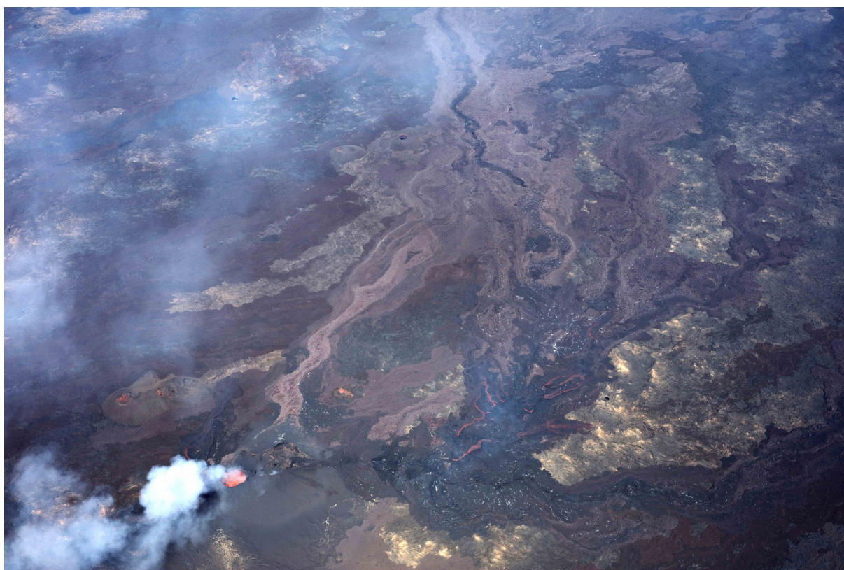
Figure 2 : Prise de vue aérienne du site éruptif le 25 septembre 2018 à 15h00 heure locale.

Le cône continue son édification, l'échancrure vers le sud d'où s'écoulait de la lave depuis le début d'éruption est désormais figée (Figure 2). La zone de fontaines actives est maintenant fermée et le lac est isolé dans une bouche sommitale unique (Figure 2). Les coulées sont conduites par un tunnel et ressortent par des résurgences situées à environ 150m en aval au sud du cône.