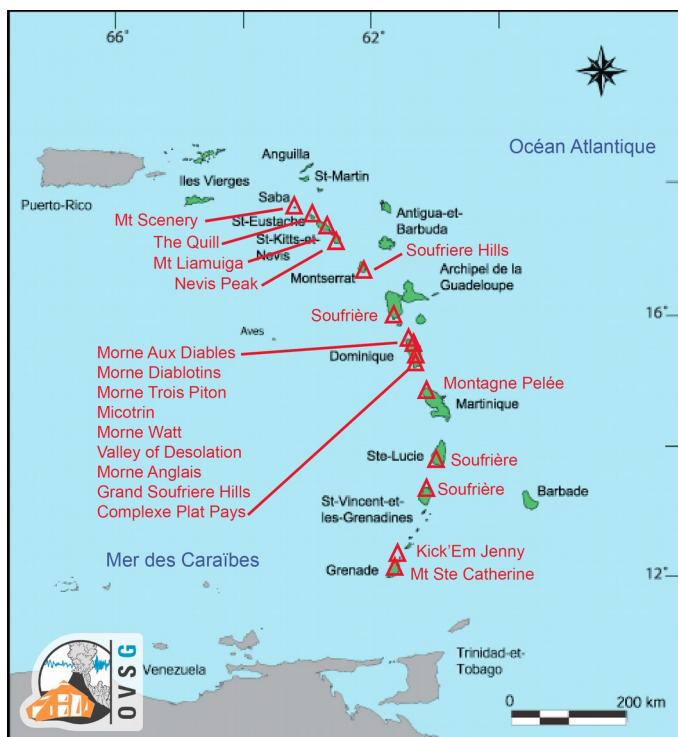
Figure 2. Carte des volcans actifs de l'arc des Petites Antilles.

La Direction de l'OVSG-IPGP le 8 juillet 2016