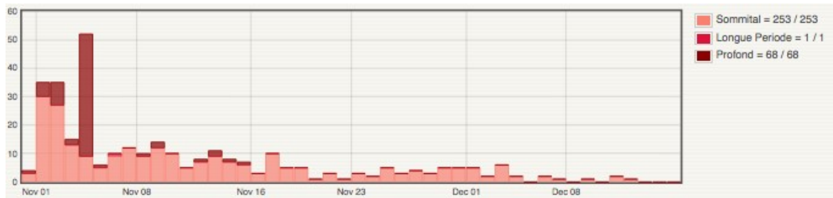
Figure 1 : Illustration de la sismicité depuis le 1 er nov. 2015

L'OVPF a enregistré 322 séismes volcano-tectoniques (fig. 1) depuis la fin de la phase effusive dont 77 depuis le retour à la vigilance.