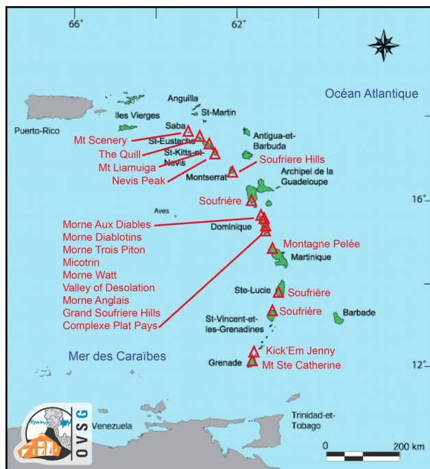
Figure 2. Carte des volcans actifs de l'arc des Petites Antilles.